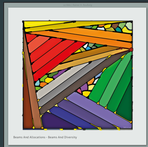
Beams And Allocations - Beams And Diversity