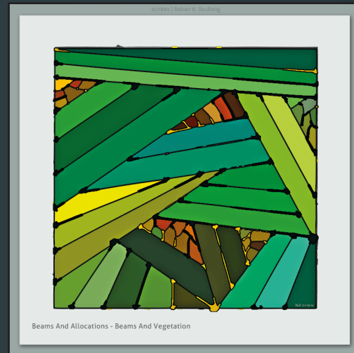
Beams And Allocations - Beams And Vegetation