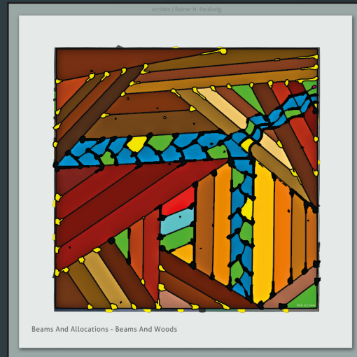
Beams And Allocations - Beams And Woods