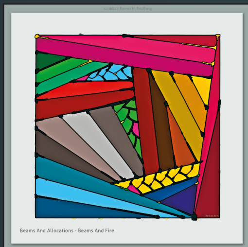
Beams And Allocations - Beams And Fire